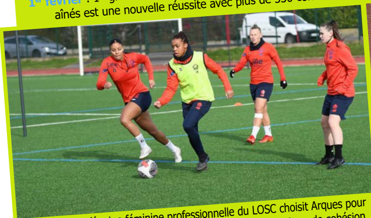
26 février : L'équipe féminine professionnelle du LOSC choisit Arques pour la qualité de ses équipements sportifs dans le cadre d'un stage de cohésion.