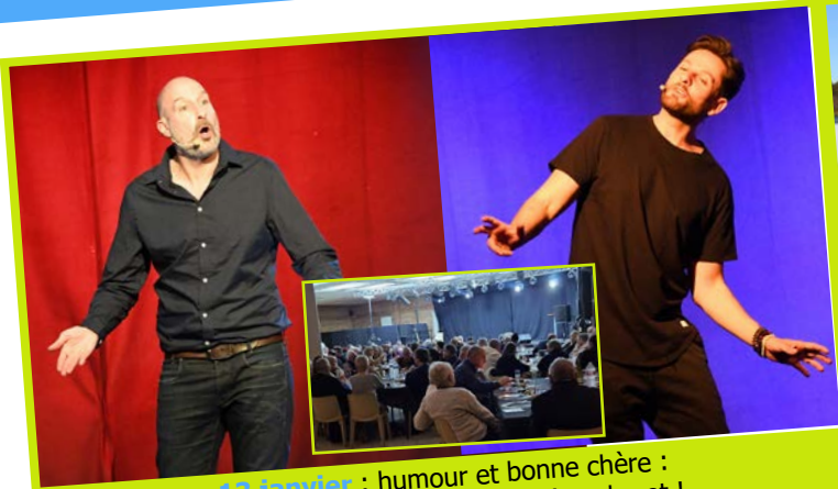
13 janvier : humour et bonne chère : la recette gagnante de la soirée cabaret !