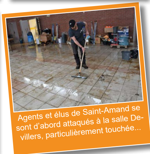
Agents et élus de Saint-Amand se sont d'abord attaqués à la salle Devillers, particulièrement touchée...