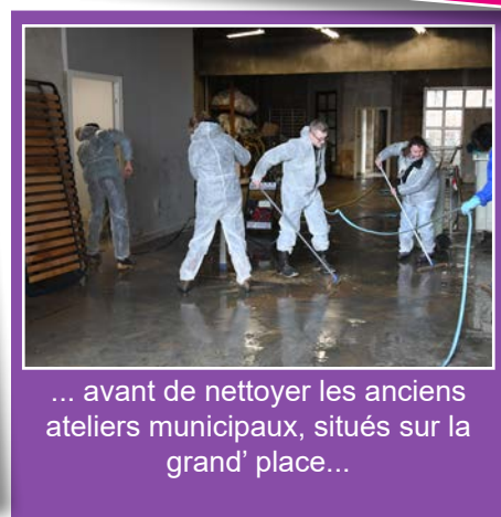
... avant de nettoyer les anciens ateliers municipaux, situés sur la grand' place...