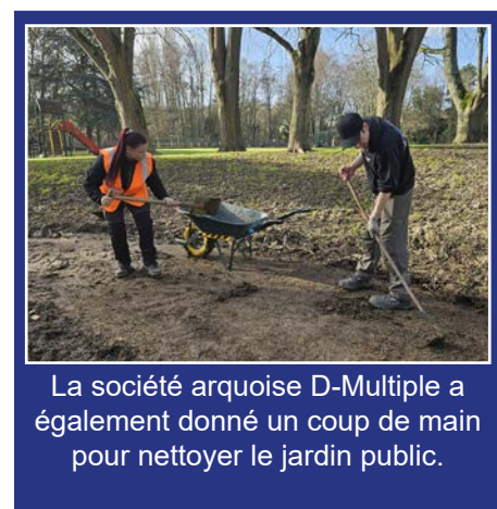
La société arquoise D-Multiple a également donné un coup de main pour nettoyer le jardin public.