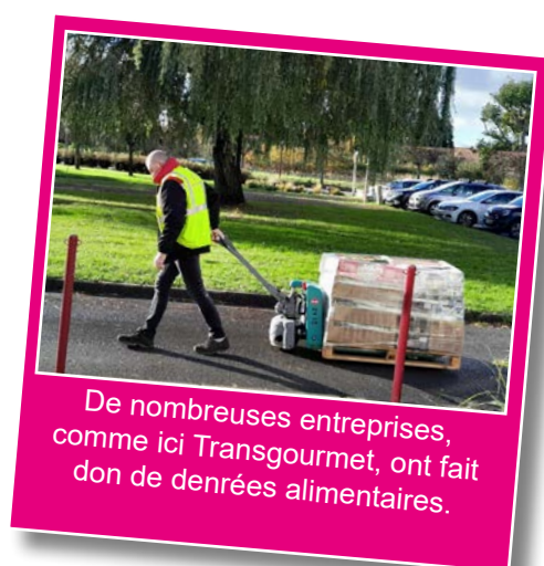
De nombreuses entreprises, comme ici Transgourmet, ont fait don de denrées alimentaires.