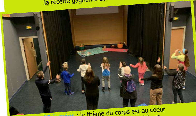
19 janvier : le thème du corps est au cœur de la Nuit de la Lecture à la médiathèque.