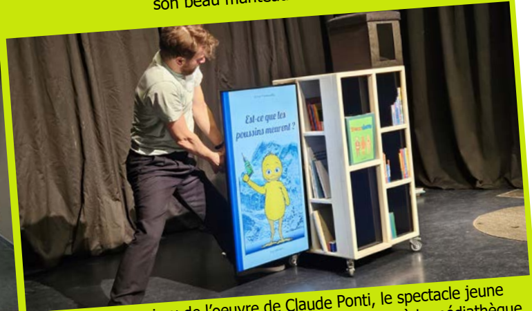
27 janvier : issu de l'oeuvre de Claude Ponti, le spectacle jeune public « 1000 secrets de poussins » fait salle comble à la médiathèque.