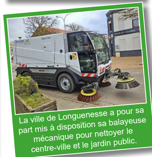
La ville de Longuenesse a pour sa part mis à disposition sa balayeuse mécanique pour nettoyer le centre-ville et le jardin public.