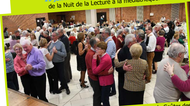
1 er février : 1 er grand RDV de l'année pour nos seniors, le Goûter des aînés est une nouvelle réussite avec plus de 330 convives !