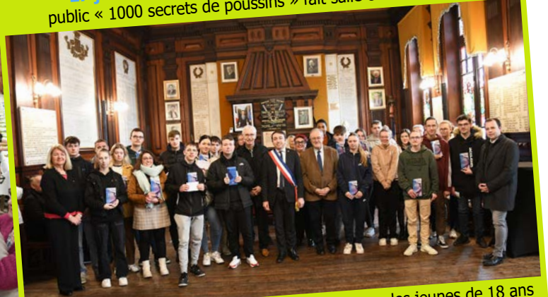
10 février : 1 er moment fort de leur vie citoyenne, les jeunes de 18 ans sont accueillis en mairie pour recevoir leur première carte d'électeur.