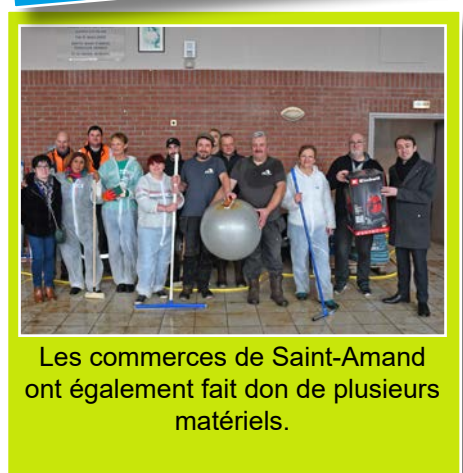
Les commerces de Saint-Amand ont également fait don de plusieurs matériels.