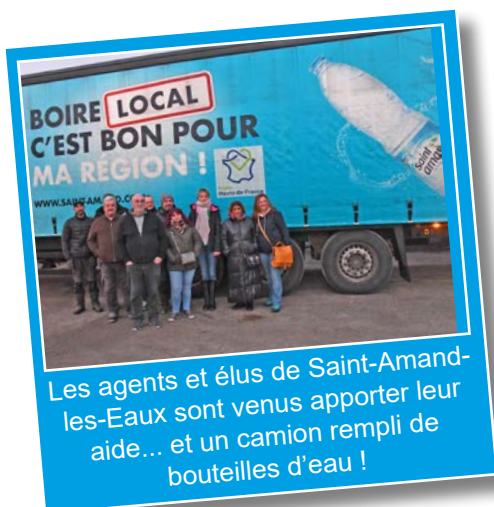
Les agents et élus de Saint-Amand-les-Eaux sont venus apporter leur aide... et un camion rempli de bouteilles d'eau !

- Les communes avoisinantes (comme par exemple Wardrecques, Longuenesse, Saint-Mar-