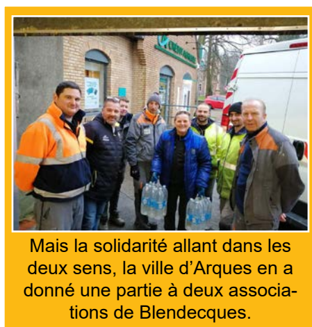
Mais la solidarité allant dans les deux sens, la ville d'Arques en a donné une partie à deux associations de Blendecques.