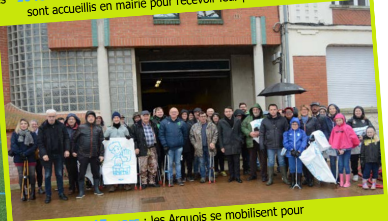
17 mars : les Arquois se mobilisent pour l'opération villages & marais propres