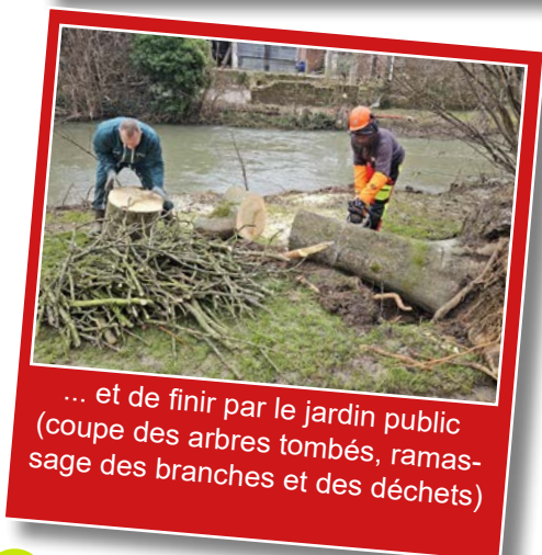
... et de finir par le jardin public (coupe des arbres tombés, ramassage des branches et des déchets)