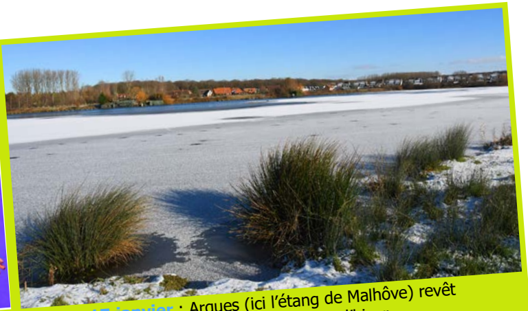
17 janvier : Arques (ici l'étang de Malhôte) revêt son beau manteau blanc d'hiver.